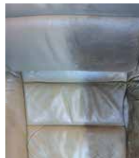
(Imm.) Fiber ProTector ristorante pelletteria