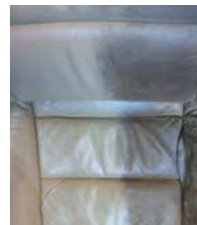
Bilden: Fiber ProTector läderrestaurering