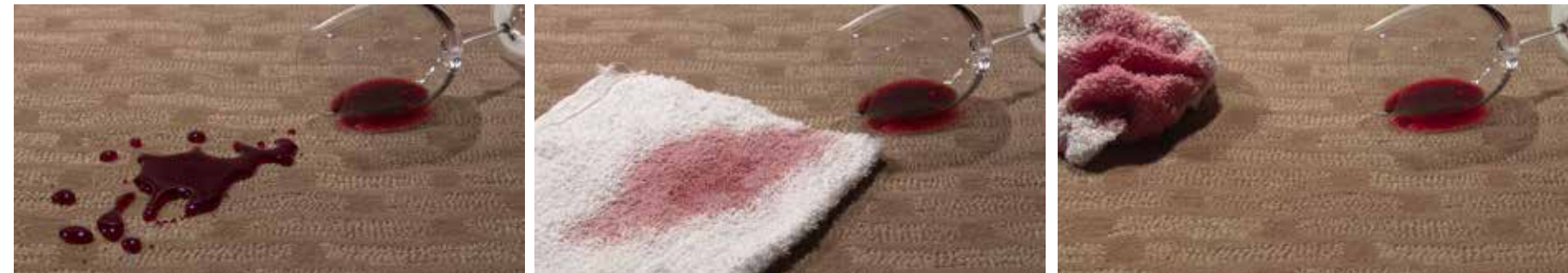
Bilderna: Spill på behandlad matta eller textil tas enkelt bort med absorberande trasa eller papper.

ELLEN FRANCKE, ADMINISTRATIONSCHEF, HANDELS- OCH SERVICENÄRINGENS HUVUDORGANISATION