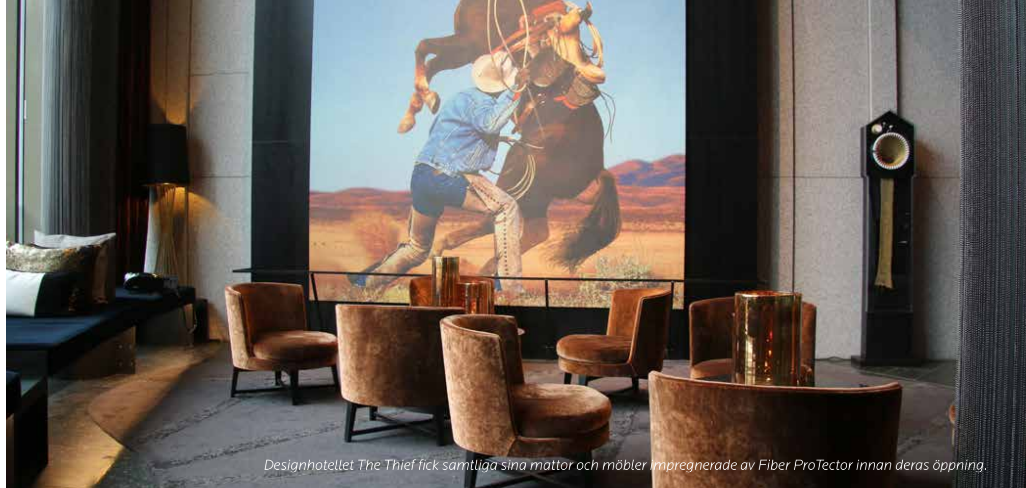
Designhotellet The Thief fick samtliga sina mattor och möbler impregnerade av Fiber ProTector innan deras öppning.

Så här fungerar Fiber ProTector: Fiber ProTector skapar ett osynligt molekylärt skydd runt varje enskild fiber. Detta blir som ett effektivt skydd mot att alla typer av organisk vätska, smuts eller damm som annars skulle tränga in i själva fibern och skapat bestående fläckar. Behandlingen skyddar också mot UV-strålar och fysiskt slitage.