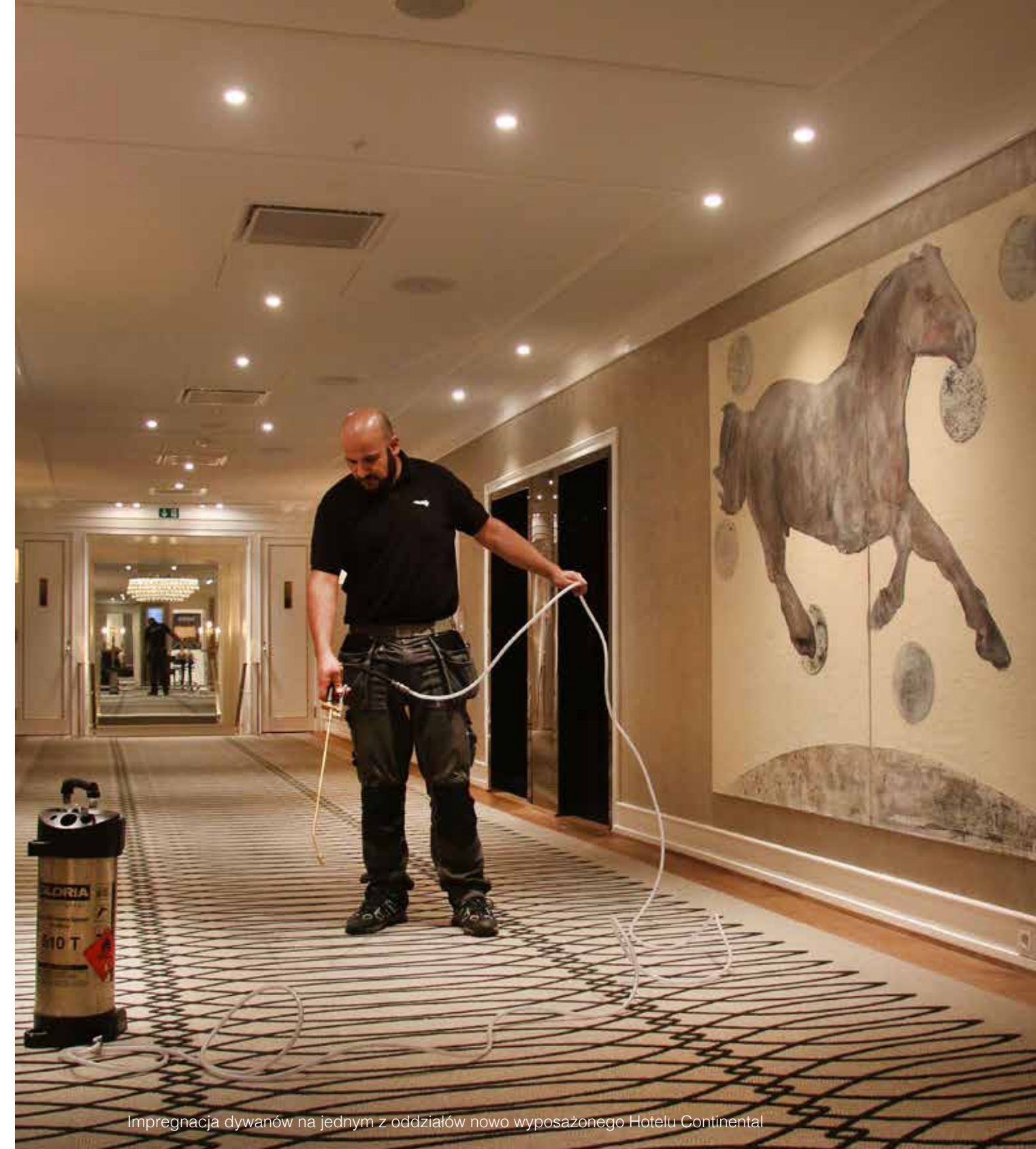
Impregnacja dywanów na jednym z oddziałów nowo wyposażonego Hotelu Continental

"Od jesieni 1999 r. korzystamy z usług Fiber ProTector Norge AS przy utrzymaniu dywanów i mebli w apartamentach biznesowych w Gardermoen w Porcie Lotniczym w Oslo. Chodzi o czyszczenie i zabezpieczanie dywanów i mebli, a także pielęgnację materiałów skórzanych. Jesteśmy bardzo zadowoleni z poziomu profesjonalizmu, jakości i skuteczności Fiber ProTector. Cieszymy się, że nasi pasażerowie postrzegają nasze apartamenty jako świeże i dobrze utrzymane".