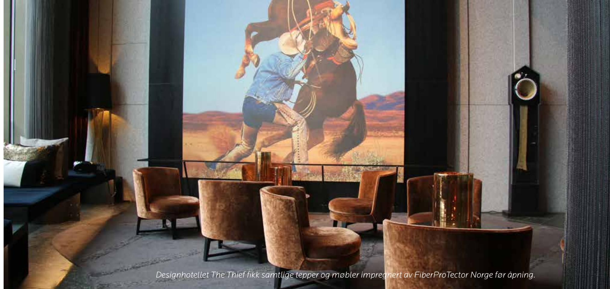
Designhotellet The Thief fikk samtlige tepper og møbler impregnerert av FiberProTector Norge før åpning.

Fiber ProTector danner en usynlig molekyllær beskyttelse rundt hver fiber. Dette virker som en effektiv beskyttelse mot at alle typer organisk væske, smuss eller støv som ellers ville trengt inn i selve fiberen og dannet varige flekker. Behandlingen beskytter også mot UV-stråler og fysisk slitasje.