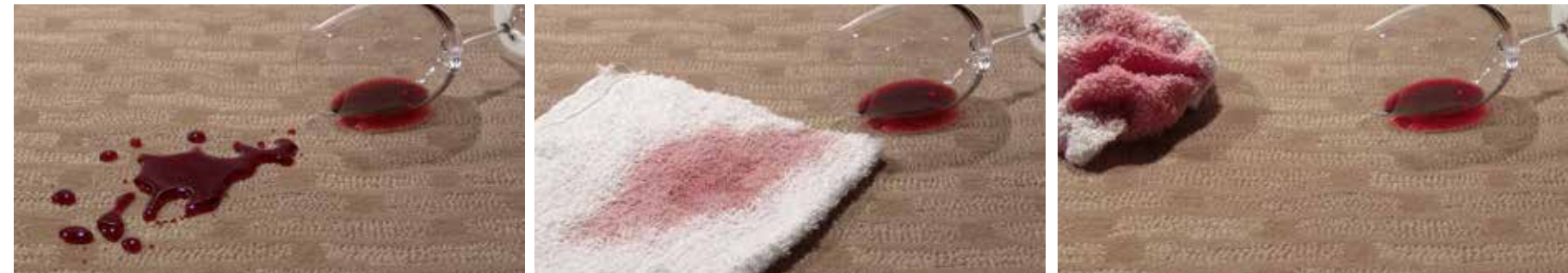
Bildene: Søl på behandlet teppe eller tekstil fjernes enkelt med absorberende klut eller papir.