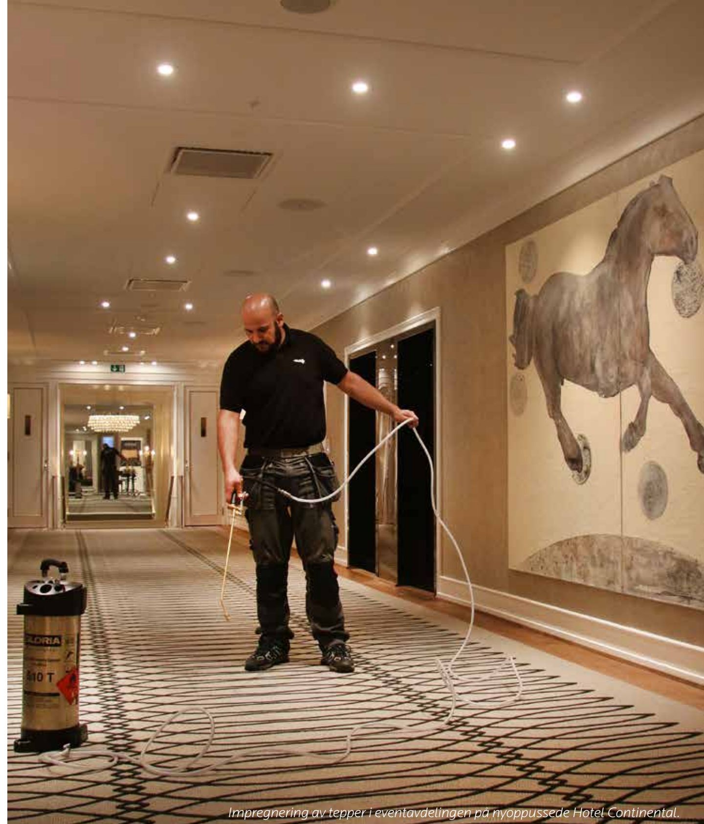
Impregnering av tepper i eventavdelingen på nyoppussede Hotel Continental.

“Vi har siden høsten 1999 benyttet oss av tjenestene til Fiber ProTector Norge AS i forbindelse med vedlikehold av tepper og møbler i våre lounges for de reisende på Gardermoen. Dette har bestått av rens og impregnering av tepper og møbler, samt skinnpleie. Vi er meget fornøyde med den profesjonalitet, kvalitet og oppfølging på tjenestene som Fiber ProTector leverer. Det er viktig for oss at passasjerene opplever våre lounges som rene og velstelte.”