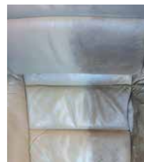
Bildet: Fiber ProTector skinnrestaurering