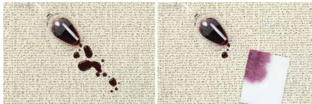
Imágenes: Salpicaduras líquidas son removidas fácilmente con papel o toallas.

Fiber Protector ® tiene un alto potencial dentro del diseño de interiores y la decoración; ya que cortinas, alfombras, tapetes y muebles de colores claros llegan a ser imposible considerar en algunos casos sin protección. Este escudo protector puede ser utilizado en todo tipo de fibras y composiciones tanto naturales como sintéticas; incluso las mas finas sedas obtienen sus beneficios sin cambiar color o textura de los materiales ya tratados.